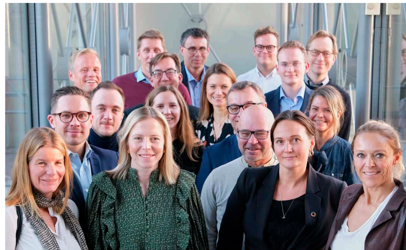
Til stede ved etableringen av RN Bærekraftsforum i november 2022, var blant annet representanter fra Aider, Azets, Amesto, SpareBank 1 Regnskapshuset SMN, Sum Regnskap og Vekstra

I 2022 har Regnskap Norge hatt rollen som co-chair i Accounting Bodies Network hos Accounting for Sustain-